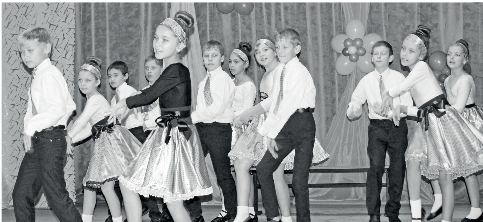
Вёртненские «Карамельки» - победители «Новой волны» 2018 в номинации «Танец», лауреаты диплома «За оригинальность».