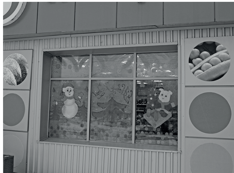
Магазины и предприятия сферы услуг украшают свои витрины и интерьеры залов.